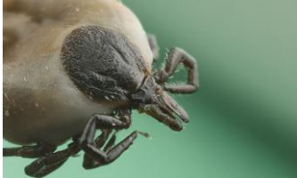
Foto van een teek

In het veld heb je kans om gebeten te worden door een teek. Dit diertje hecht zich aan je lijf en gaat dan op zoek naar een plaats om bloed op te zuigen. De teek kan echter een ziekte, de ziekte van Lyme, bij zich dragen die wordt doorgegeven aan personen.