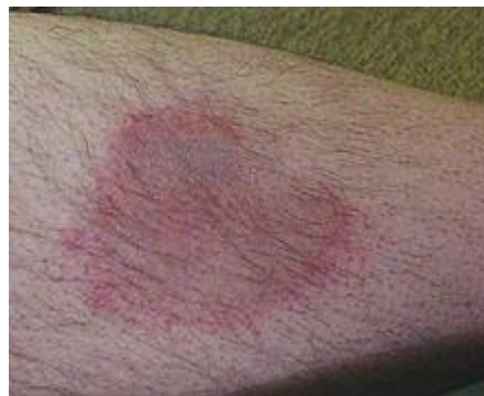
Foto's van een tekenbeet waarbij contact opnemen met de huisarts noodzakelijk is.