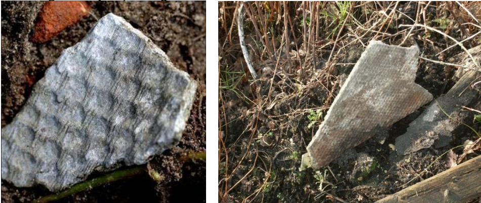
Typische foto's van asbest in de grond

Afhankelijk van de werkmethode (boor- dan wel proefsleuvenonderzoek / ontgravingen) staat in hoofdstuk 4, paragraaf 4.5 en 4.6 beschreven wat de maatregelen zijn op het gebied van chemisch onderzoek.