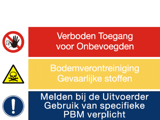
Bebording op de saneringslocatie