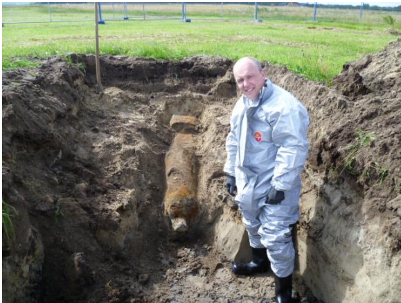
Aangetroffen bom in het veld

Indien er sprake is van de aanwezigheid van niet geëxplodeerde munitie zal de munitie eerst opgespoord moeten worden alvorens er werkzaamheden worden uitgevoerd.