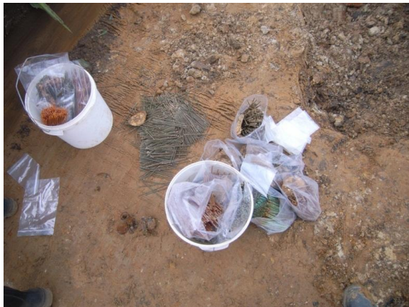
Kruit in de bodem (lijkt op spaghetti)

Indien de locatie niet verdracht is en je treft toch munitie aan, stop dan direct met de werkzaamheden.